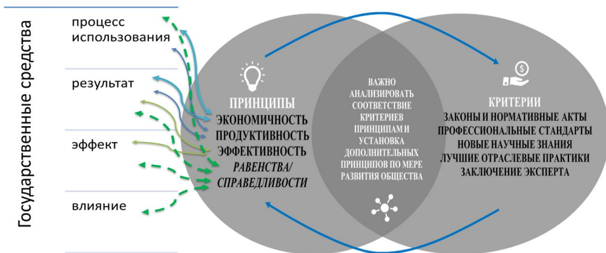
Рисунок 2 - Взаимосвязь между схемой государственного вмешательства, принципами и критериями

Эффективность на втором уровне вытекает из первоначальной концепции экоэффективности (Heijungs, 2007) [2]. В первом определении Шальтеггера и др., 1990) [3] эко эффективность определяется как соотношение между предполагаемыми эффектами (или выгодами) и воздействием на окружающую среду , оцениваемым с помощью конкретных моделей оценки воздействия.