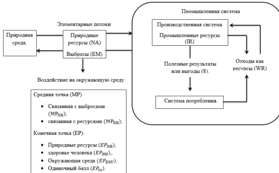
Рисунок 3 - Потоки и воздействия, связанные с использованием природных ресурсов

Инвентаризованные потоки в уравнении. (1) могут быть природные ресурсы, промышленные ресурсы, отходы как ресурсы или выбросы. Эти потоки схематически представлены на рисунке 3.