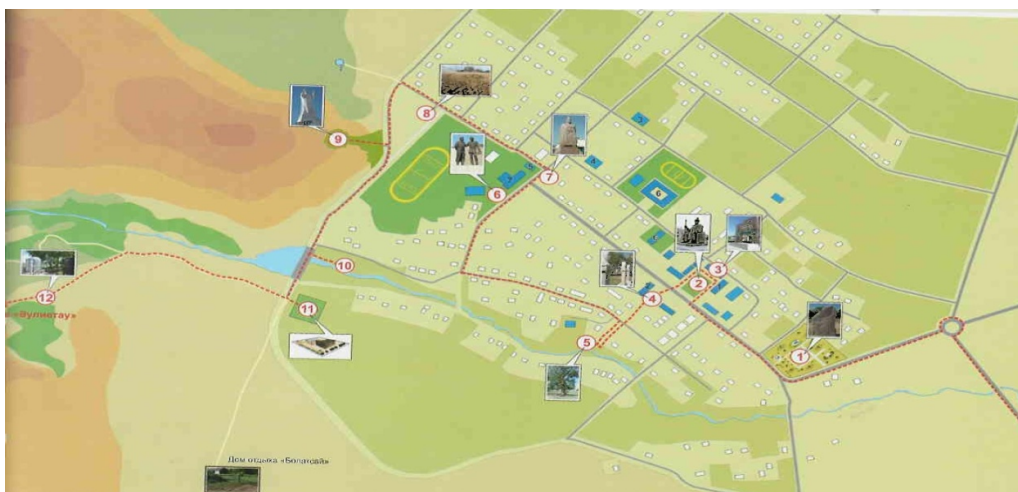
3 - Сурет - «Ұлытау» селосы бойынша экскурсиялық бағыттар [2]

Ұлытау ауданының қорық-мұражайы бойынша экскурсиялардың саны екі жыл көлемінде 83 бірлікке артты. Бұл шағын аудан үшін жақсы көрсеткіштердің бірі болып табылады. 2016 жылғы деректер бойынша негізгі қордың жәдігерлер саны 1952 бірлікті, жыл ішінде көрмеге қойып көретілетін жәдігерлер саны 8 бірлікті, жыл ішінде келіп түскен жәдігерлердің саны 112 бірлікті, дәрістердің саны 44 бірлікті құрайды.