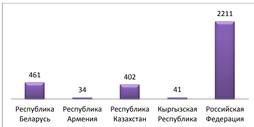
Рисунок 2 – Количество испытательных лабораторий ТС

Информация Единого реестра Евразийского Экономического союза является общедоступным и каждый потребитель в случае сомнения относительно качества и безопасности продукции, либо в случае заинтересованности может проверить наличие подтверждающих документов соответствия продукции в данном реестре.