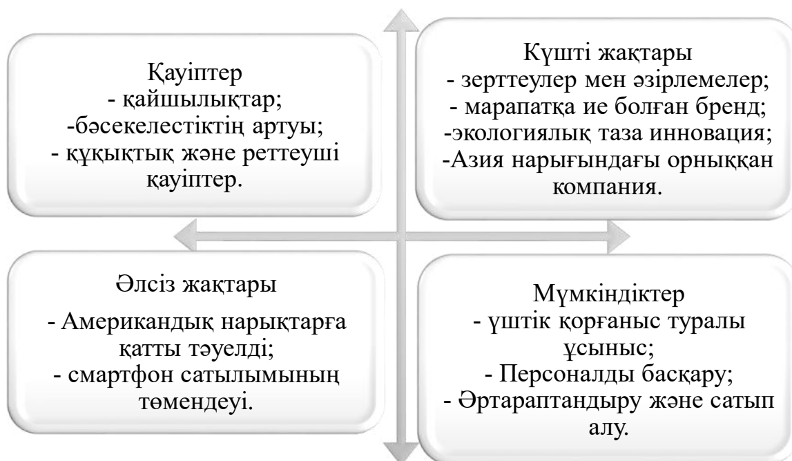
Ескерту- Автормен деректер негізінде құрастырылған

SWOT талдау жалпы кәсіпорынның бәсекеге қабілеттілігін зерттеу кезіндегі ең негізгі талдау болып табылады. Ол компанияның нақты және ағымдағы жағдайын, сондай-ақ оның болашағын бағалайды. Samsung компаниясының SWOT талдауы 2-суретте көрсетілген.