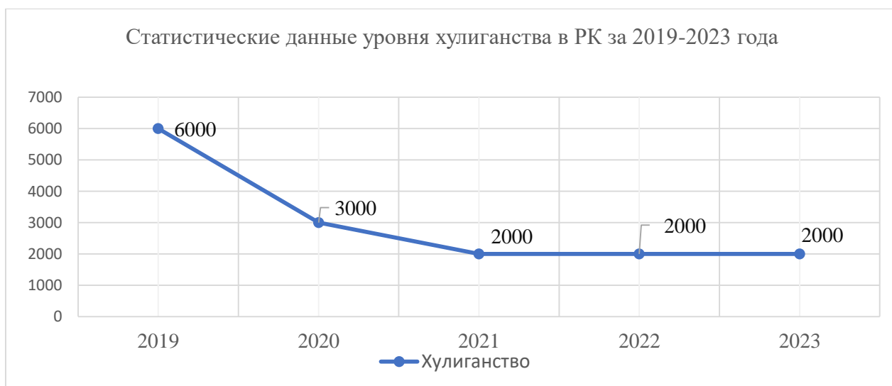
Рисунок 3 - Статистические данные уровня хулиганства в РК за 2019-2023 года

Необходимо отметить усиленную работу правоохранительных органов против правонарушений, например – в общественных местах устанавливаются «Кнопки SOS», позволяющие осуществлять моментальную связь с офицерами центров оперативного управления полиции и передавать необходимую информацию. Для предупреждения краж мобильных телефонов продолжается работа по регистрации номеров с привязкой к IMEI-коду и его владельцу, что позволяет оперативно блокировать похищенные устройства. Развивается принцип «нулевой терпимости» к правонарушениям. Так, на сегодняшний день выявлено на 19% (на 1,5 млн) больше административных правонарушений. Среди них факты нарушения тишины и запрета на курение, мелкие хулиганства и т.д.