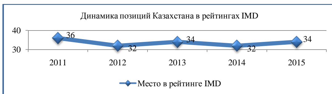
Рисунок 2. Динамика позиций Казахстана в рейтингах IMD за 2011-2015 гг.

Примечание: составлено автором на основе данных Доклада о мировой конкурентоспособности Международного института развития менеджмента (IMD) за 2011-2015 гг. [3-6].