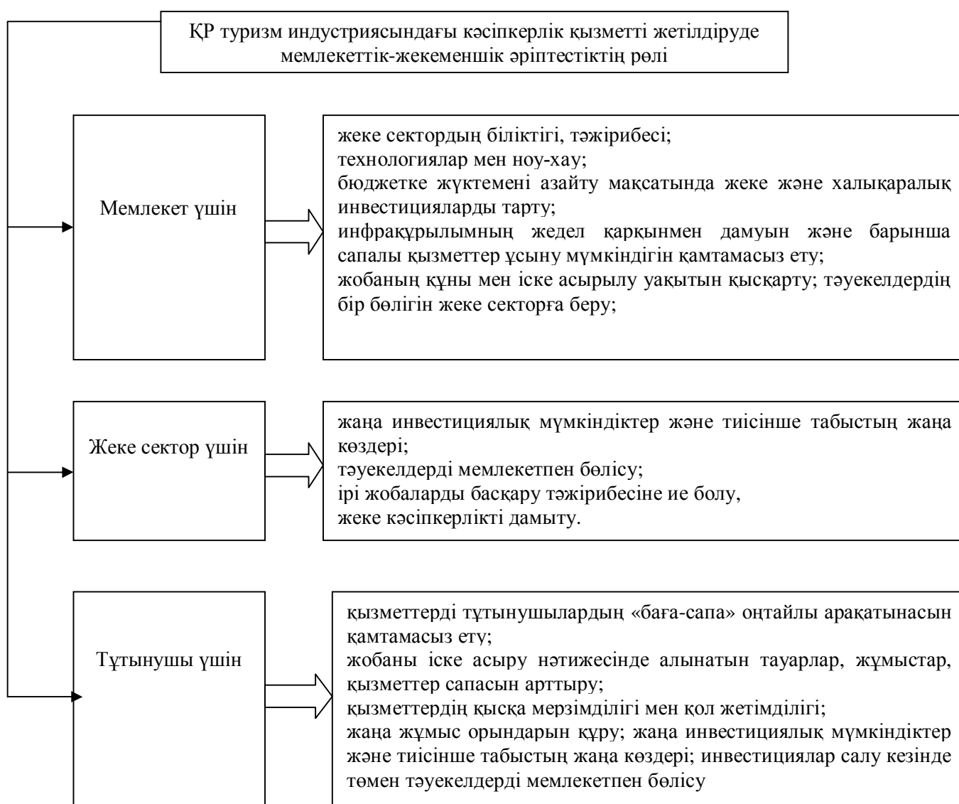
Сурет 1 - ҚР туризм индустриясындағы кәсіпкерлік қызметті жетілдіруде мемлекеттік-жекеменшік әріптестіктің рөлі

Ескерту. Әдебиеттер негізінде [3,4] автор құрастырған