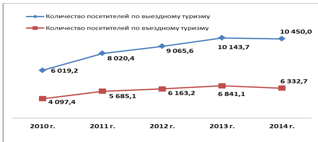
Рисунок 1. Динамика посетителей по въездному и выездному туризму, тыс. чел.

Из данных, приведенных на рисунке 1, видно, что количество въехавших иностранных туристов на территорию нашей страны растет, в 2014 году по сравнению с 2010 годом рост составил 154,6%, либо больше на 2,2 млн. человек, однако необходимо отметить, что Казахстан все-таки остается донором для мирового туристического рынка.