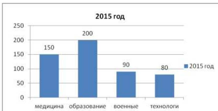
Рисунок 2 – Кадровый состав в Казахстане Примечание: Составлено авторами на основании[1].

Если рассматривать занятое население, то оно представляет собой важнейший ресурс государства, эффективная реализация потенциала которого требует специальных решений в зависимости от особенностей конкретных производственных задач, решаемых каждой группой наемных работников либо отдельным работником. Именно занятое население является краеугольным камнем в конкурентоспособности предприятия ее экономическом росте и эффективности развития в целом государства. Анализ кадрового состава в Казахстане за 2015 год по специальностям можно представить (смотрите рисунок 1):