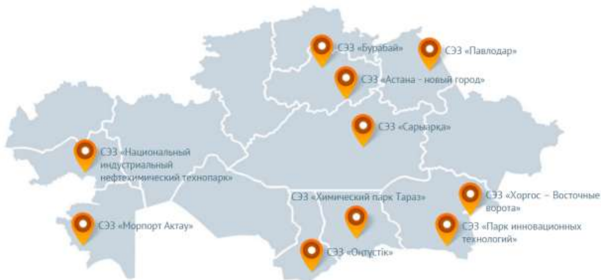
Рисунок 1. Специальные экономические зоны Республики Казахстан

поддержки отраслей экономики и решения социальных проблем, привлечения инвестиций, технологий и современного менеджмента, создания высокоэффективных и конкурентоспособных производств, в Республике Казахстан Указами Президента Республики Казахстан от созданы 10 специальных экономических зон, которые показаны на рисунке 1.