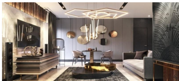
Сур. 1 Әсем безендірілген интерьер

жарнаманы біріктіру нобайлар жасаудан да оңай болмай шығады (Сурет 1). Бейнелеу өнері бір-бірінен бөлінуі мүмкін бірақ көркем безендірумен терең байланысты.