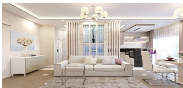
Сур.2 Ақ түстік шешімдегі интерьер