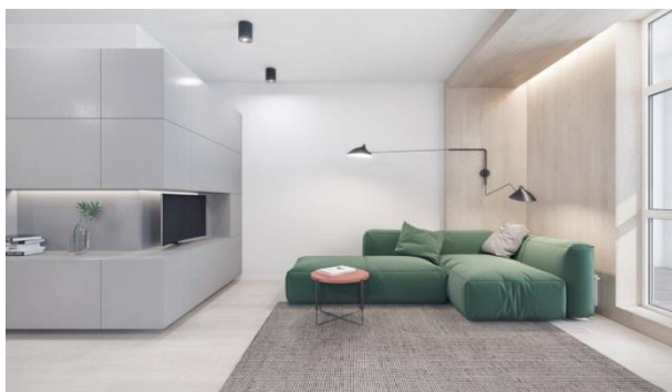
Сур.2 Минимализм стиліндегі қонақ бөлме

Интерьер дизайнында жоғары технологияны басқа стильдерден оңай ажыратуға болатын көптеген сипаттамалық белгілер бар. Олардың ішінде: