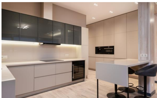
Сур.4 Хай-тек стиліндегі ас үй дизайны

футуристік ас үй үшін міндетті элемент. Үстелдер мен беттер тегіс, жылтыратылған болуы керек. Жабуға арналған ағаш дәндеріне рұқсат етіледі, бірақ олар тегіс және лакпен жабылуы керек [2].