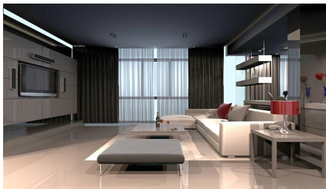
Сур.1 Хай-тек стиліндегі қонақ бөлменің дизайны

Жоғары технологиялық адамның болашаққа деген мәңгілік ұмтылысын және оған бүгін қол тигізуге деген ұмтылысын бейнелейді. Бұл стиль тұрғын үйді ұйымдастырудың ең батыл идеяларын шындыққа айналдыруға мүмкіндік береді және дизайнның ең қымбат бағыттарының біріне жатады және оны 1-суреттен байқай аласыздар. Өткен ғасырдың 70-ші жылдарында кеш модернизмде қалыптасқан жоғары технология бұрынғы архитектуралық стильдердің қисынды жалғасы болды. Динамикалық және жарқын стиль талғамға сай болды, ал 10 жылдан кейін түпнұсқа ғимараттар бүкіл әлемдегі қалалардың сәніне айналды.