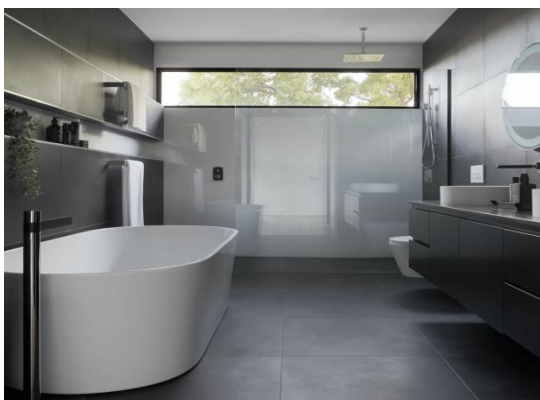
Сур.5 Хай-тек стиліндегі ванна бөлме дизайны

Минималистік сантехника-кез-келген жоғары технологиялық ванна бөлмесінің атрибуты. Қабырғалар үшін қара және ақ түстер жақсы жұмыс істейді. Тауашалардағы Имитациялық тас немесе рельефті сылақ қолайлы. Артқы жарық болған кезде интерьердің мұндай бөлшектері стильді және үйлесімді көрінеді.