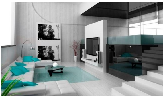
Сур.4 Қабырға басып шығарылған қонақ бөлмесі және үлкен теледидар

6. Ақ жақтаулары мен ашық түсті металл перделері бар үлкен пластикалық терезелер. Терезе саңылауларында түсін өзгерте алатын арнайы әйнектер орнатылған деген сияқты хай-тек стилін басқа стильдерден ажыратуға болады[4].