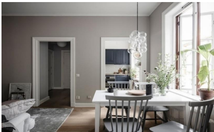
Рис. 4 Просторная кухня-гостиная в скандинавском стиле

Ощущение свободного пространства. В северных традициях не захламлять пространство квартиры излишними деталями – должно быть ощущение воздуха, свободного пространства. У мебели и предметов должно быть «пространство, чтобы дышать».