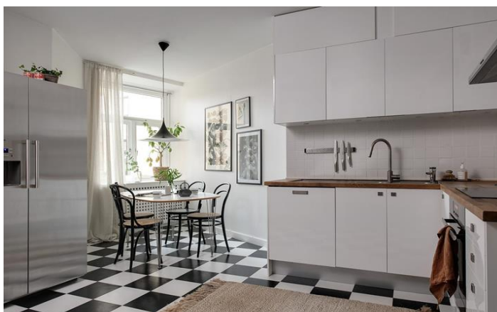
Рис. 5 Лаконичность скандинавского стиля

Простая эргономичная мебель. В употреблении только лаконичная и функциональная мебель. Важен точный расчет, высшая степень удобства использования, простота геометрии и максимальная эргономичность.