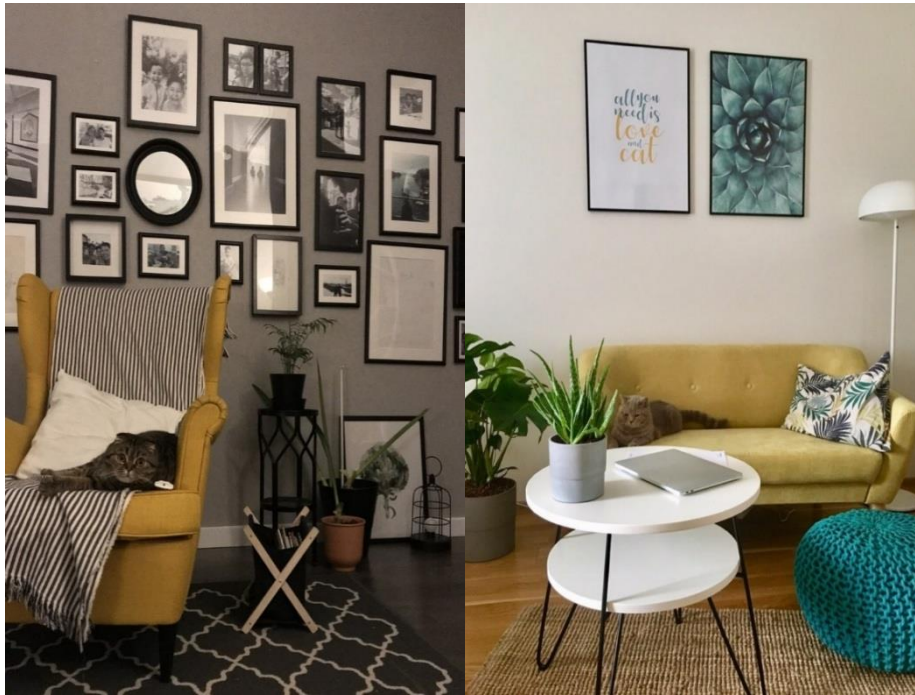
Рис. 9 Яркое кресло, яркий диван как акцент в интерьере как акцент в интерьере

Уютный, светлый, атмосферный – так можно описать стиль, что покорило сердца миллионов людей на планете – стиль Скандинавия. Он известен своей простотой, практичностью и многофункциональностью. Это стиль для тех, кто ценит простоту, лаконичность и отличное качество. В этот стиль легко влюбится, ведь он создан, чтобы дарить спокойствие, умиротворение и качественную жизнь.