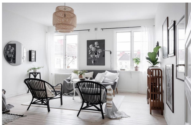
Рис. 8 Особенности скандинавского стиля

Аксессуары и декор. Их обычно немного, они невычурны и функциональны, не создают лишних помех. Часто используются зеркала – для отражения естественного света, постеры и абстрактные полотна – в качестве цветовых и стилистических акцентов, комнатные растения – для усиления эффекта сближения с природой, а также привнесения цвета и текстуры без загромождения пространства.