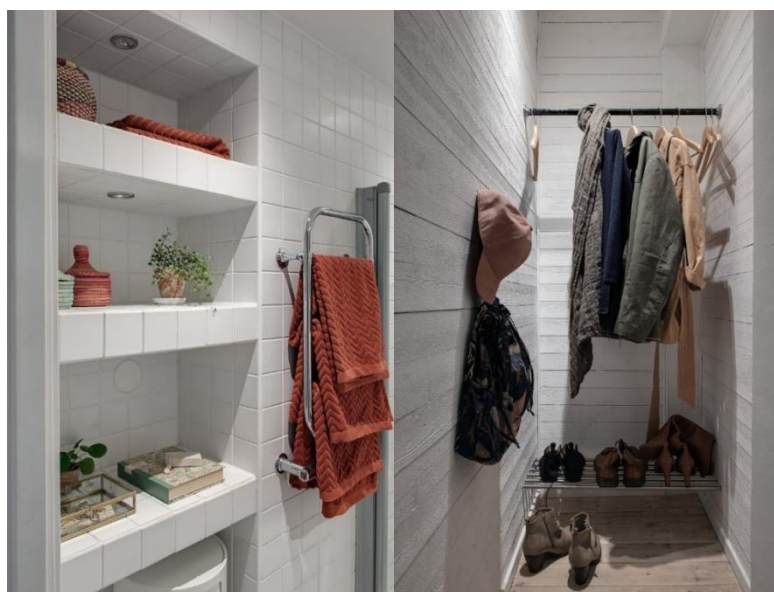
Рис. 7 Открытые полки. открытое место ванной в скандинавском стиле для хранения в прихожей

места. В комнате должно быть достаточно мест для хранения, но без загромождения, поэтому преимущественно находят применение открытые стеллажи и системы хранения.