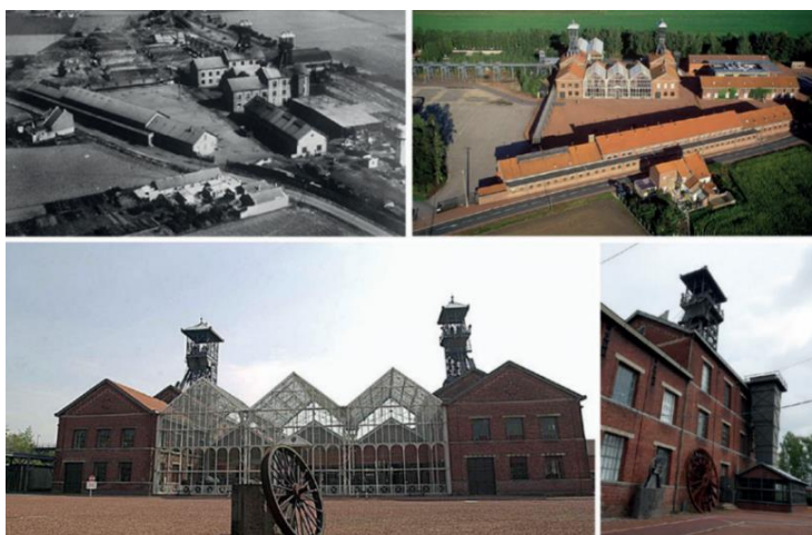
Рисунок 3. Комплекс шахты Деллоие в Леварде (Франция) преобразован в Центр истории горнодобывающей промышленности [3]

В заключение следует отметить, что адаптивное повторное использование — это мощный инструмент для сохранения исторических зданий и одновременно удовлетворения потребностей современного общества. Модернизация старых построек для новых целей выступает в роли создания устойчивых, инновационных пространств, которые уважают прошлое и смотрят в будущее. Однако, процесс адаптивного повторного использования требует тщательного планирования, учета истории и культурного значения здания. Он также требует приверженности к устойчивому развитию и использованию экологически ответственных методов. На примере успешных проектов адаптивного повторного использования зданий по всему миру мы можем увидеть потенциал этой практики для оживления сообществ, содействия экономическому развитию и создания уникальных, вдохновляющих пространств, которые отмечают богатство нашего общего наследия.