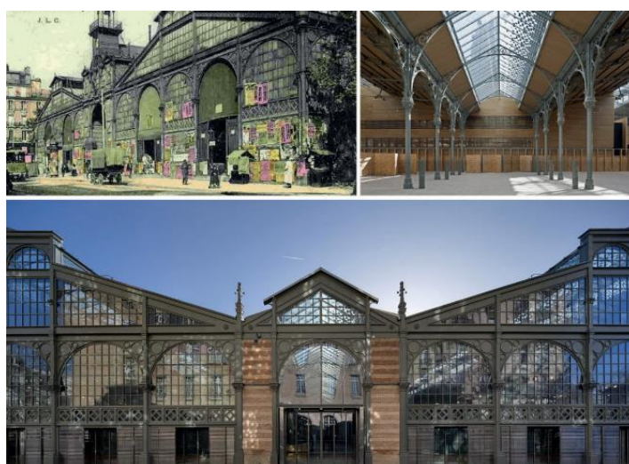
Рисунок 2. Рынок Карро дю Тампль в Париже [2]

Хотя преобразование исторических зданий в современные пространства для устойчивого использования является захватывающей перспективой, которая предлагает многочисленные преимущества, существует также ряд проблем, которые необходимо