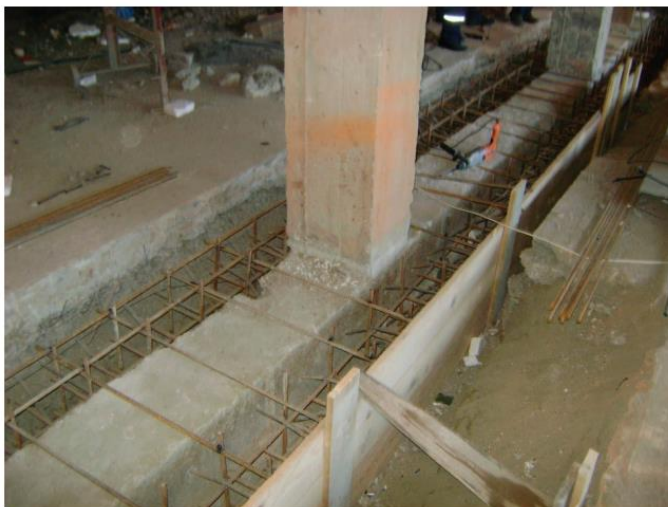
Сурет 1. Таспалы іргетасты темірбетон құрсамасымен нығайту