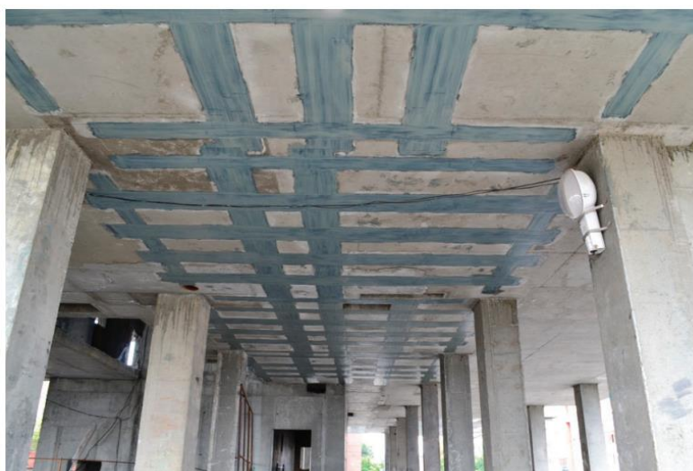
Сурет 2. Көміртекті талшықтармен еден плиталарын күшейту

Белгілі бір темірбетон конструкциясын күшейту әдісін таңдамас бұрын, бірқатар тексеру есептеулерін жүргізу қажет, соның арқасында жойылудың ықтимал сипаты мен траекториясы анықталады. Тексеру есептеулерінің негізінде құрылымдардың пайдалануға жарамдылығын, оларды күшейту қажеттілігін немесе құрылымның толық жарамсыздығын анықтау керек. [3] есептеуді үш негізгі параметр бойынша жасауға болады: