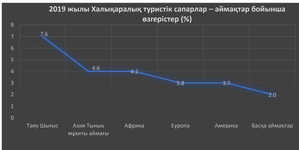
Сурет 1. 2019 жылы Халықаралық туристік сапарлар – аймақтар бойынша өзгерістер (%)

2020 жылдың қаңтар-қазан айларында төмендеу 2019 жылдың сәйкес кезеңімен салыстырғанда 900 миллион адамға халықаралық туристік келу санының азаюын білдіреді және халықаралық туризмнен 935 миллиард АҚШ доллары көлеміндегі экспорттық кірістің жоғалуына әкеледі, бұл жаһандық экономикалық дағдарыстың әсерінен 2009 жылғы шығыннан 10 есе көп.