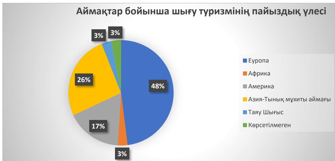
Сурет 2. Аймақтар бойынша шығу туризмінің пайыздық үлесі

2022 жылы бүкіл әлем бойынша шетелдік туристердің келу саны 900 млн. бұл 2021 жылмен салыстырғанда екі есе көп, бірақ пандемияға дейінгі 2019 жылғы көрсеткіштің 63% - ғана құрайды, деп хабарлайды БҰҰ Дүниежүзілік Туристік Ұйымы.