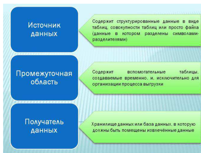
Рисунок 2 - Архитектура хранилища данных с помощью процесса ETL.

Архитектура хранилища данных с помощью процесса ETL представлена на рисунке 2 в виде трех компонентов: источника данных, промежуточной области и получателя данных.