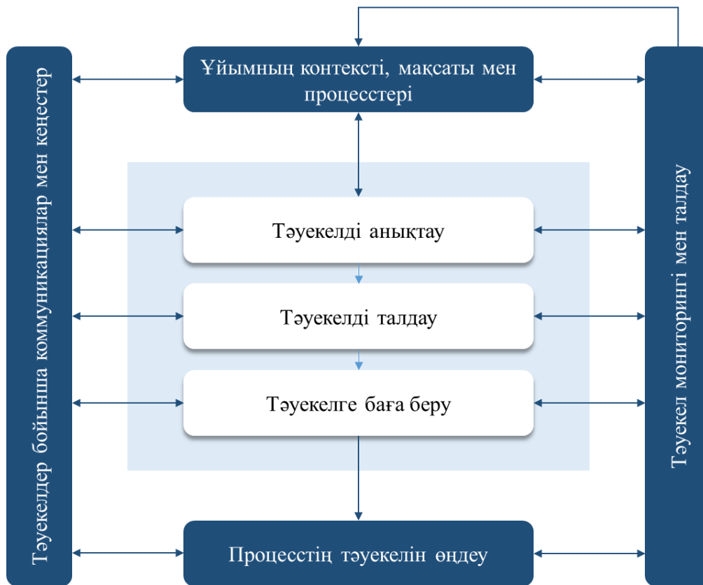
1-сурет Тәуекелді басқарудың жалпы алгоритмі

Үш стандарттың – COSO, FERMA және ISO 31000 тәуекелдерді басқарудың жалпыланған моделі келесідей: компанияның контекстін орнату, мақсаттарды, процестерді анықтау. Содан кейін тәуекелдерді анықтау, талдау және бағалау, одан кейін - тәуекелдерді өңдеу. Тәуекелдерді басқару процесінің әрбір сатысында тәуекелдер бойынша кеңес беру және хабарлау, сондай-ақ тәуекелдерді бақылау және талдау қажет [2,6,7]