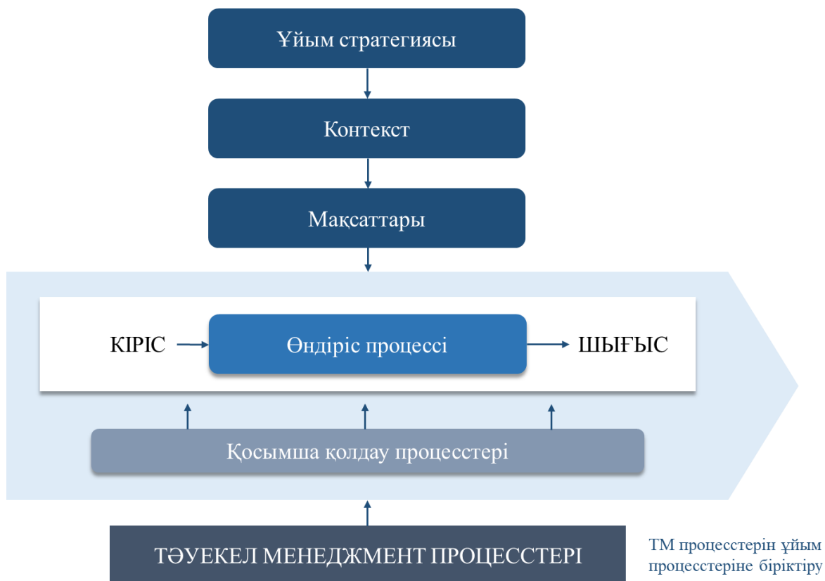
2-сурет Тәуекел менеджменті процесстерін ұйымның өндіріс процесстеріне біріктіру

Менеджмент жүйесін тәуекелге бағдарланған ету үшін біз тәуекелдерді басқаруды қолданыстағы процестерге енгізуге, біріктіруге тиіспіз. Мұны қалай жасау керектігі төменде түсіндіріледі. Ең алдымен, біз процесс моделін құрастырамыз және оған тәуекел менеджменті процесін біріктіреміз, 2-суретті қара.