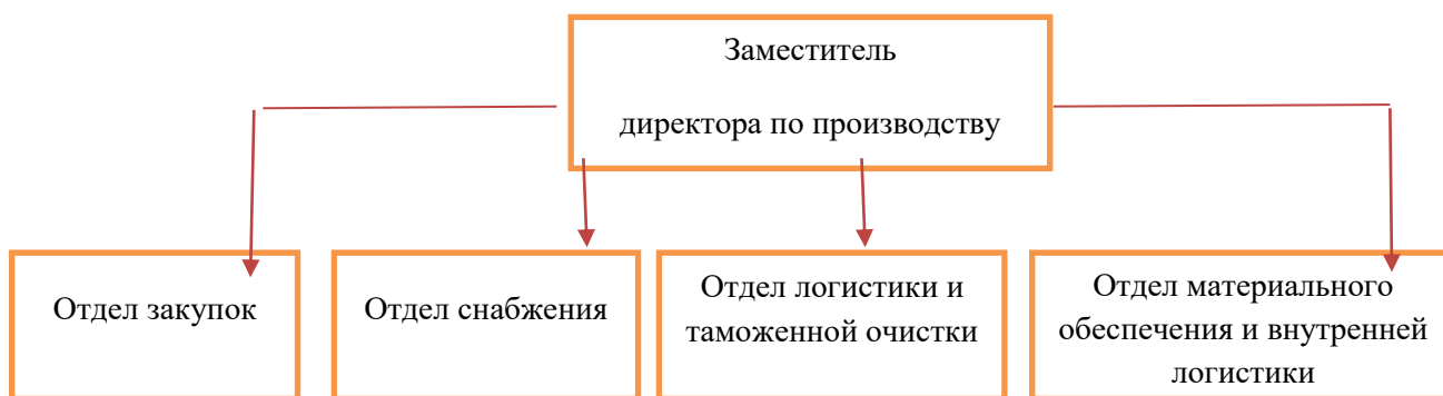
Рисунок 2. Организационная структура логистического подразделения ЧАО «ЗТР»

Результаты анализа организационной структуры позволяют сделать вывод, что структурное подразделение, подчиненное заместителю директора по производству, имеет выраженную таможенную направленность и дают право определить уровень внедрения логистики на предприятии как фрагментарный. Таким образом, в результате проведенного исследования было определено, что на исследуемом предприятии логистический подход к управлению внедрен частично (фрагментарно), что, с одной стороны, указывает на организационную готовность предприятия к внедрению данной управленческой технологии. С другой стороны, следует отметить, что фрагментарного внедрения логистического управления в существующих экономических условиях явно недостаточно, что требует разработки рекомендаций по дальнейшему внедрению логистического подхода к управлению машиностроительными предприятиями.