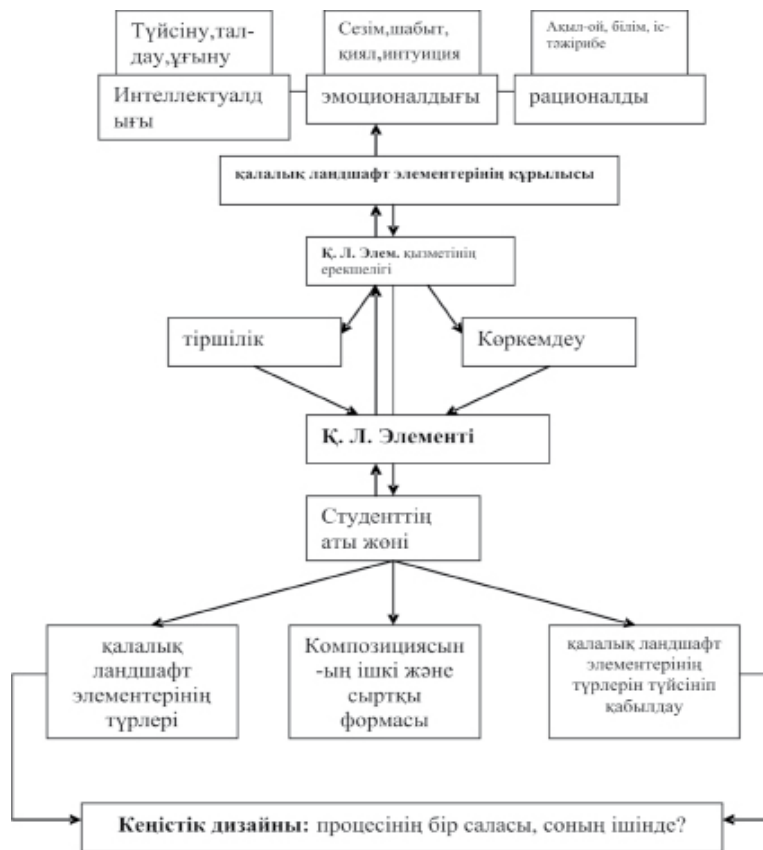
1 сурет - Кеңістік дизайн саласын оқыту процесінің құрылысы

Ертеден келе жатқан тұрмыстық заттар дизайнына сәндік-қолданбалы өнер материалдары жатады. Дегенмен студенттерді 1 суретте берілгендей мысалы, кеңістік дизайн саласын оқыту процесінің құрылысын ұсынуға болады.