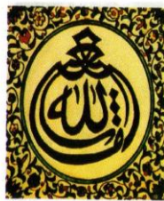
Каллиграфическая надпись по мотивам: «Аллах акабар» («Бог велик»). Турция. XII в.