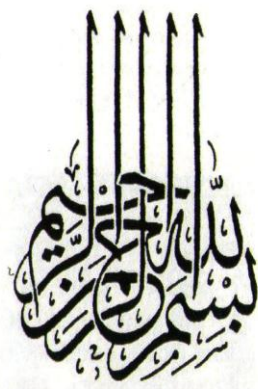
«Во имя Бога Милостивого и Милосердного».

Каллиграфия и орнамент – вот те элементы, которые стали основой декоративного убранства исламских культовых сооружений, что существенно