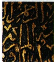
Образы каллиграфии из мечети Ислам.