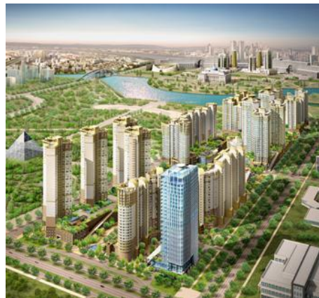
Сур. 3. «Хайвилл» тұрғын үй кешені, Астана қ.

Сонымен бірге, Астананың тұрғын үй фондының құрылысының үлкен көлемі, сәулеттегі прогрессті бағыттағы, өткен ғасырдың 40-50 жылдарда тараған функционализм идеясын кеңінен таралуына әсер еткен. Соның бірінші мысалы ретінде, ондағы функционалды аспект, кеңінен сәулеттік жайғастыру өңдеуін алады, Есіл өзенінің жағалауында жаңа тұрғын үй кешендері пайда болады (сур. 4). Тағы айтатын жай, жаңа тұрғын үй фондының көбі, Астанада салынған, функционализм идеясына бет бұрған, ол біріншіден, экономиялы және индустриалды технологиялы екенін айқындайды.