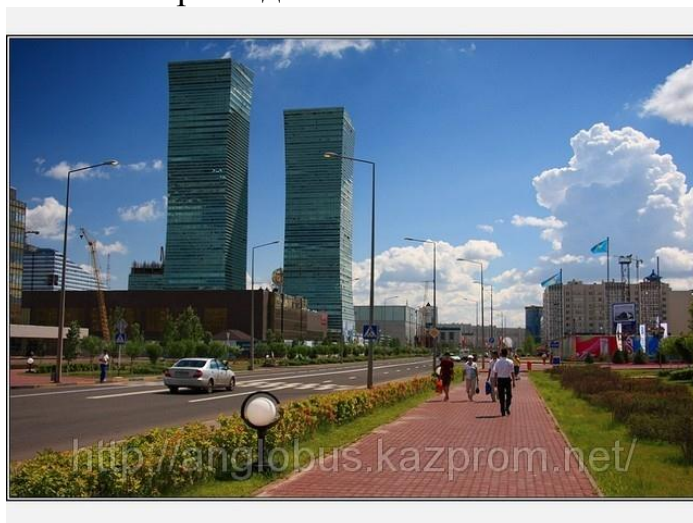
Сур.1. «Северное сияние» тұрғын үй кешені, Астана қ.

болғаны, оның атауы «Северное Сияние»- солтүстік Қазақстан табиғатының барлық сұлулығын ашып көрсетеді.