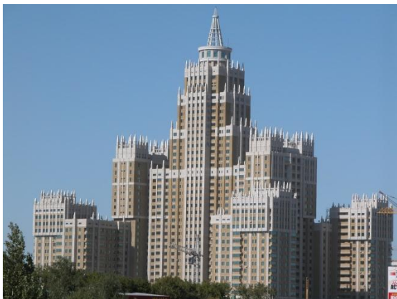
Сур.6. «Триумф Астаны» тұрғын үй кешені

Соңғы салынған құрылыстардың ішінде, неоклассика стиліндегі, сулы-жасыл бульварында салынған «Нұрсая» тұрғын үй кешені айрықшаланады. Сонымен бірге, оған сипатты болған классика сәулетінің дәстүрлі элементтеріне бет бұрылыс жасағаны, бірақ-та жаңа оқылыстағы, қазіргі заман құрылыс материалдарын қолдануына байланысты, мысал ретінде керамогранит, қазіргі заман витражды шыны (сур.7).