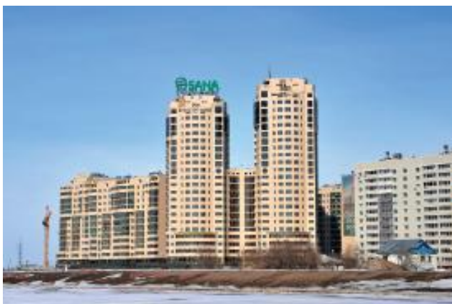
Сур. 4. Есіл жағалауындағы тұрғын үй кешені, Астана қ.

Астана сәулетіндегі жаңа тұрғын құрылыстарының өңір факторының негізіндегі бейнеқұру мүмкіндігінің ізденісі маңызды орнын алады. Қазіргі уақытта бірқатар салынған кешендер, ұлттық стилистика мен колоритының қазірге заманға сай интерпретациясын көрсетеді. Соның ішінде Абай және Республика кешен бойындағы, Есіл өзенінің жағалауындағы «Арман» тұрғын үй кешені. Қасбет экстерьерлеріндегі декор элементтері, сипатты күмбезбен аяқталуы, сәулетшілердің осы бағыттағы ізденісін айқын көрсетеді (сур. 5).