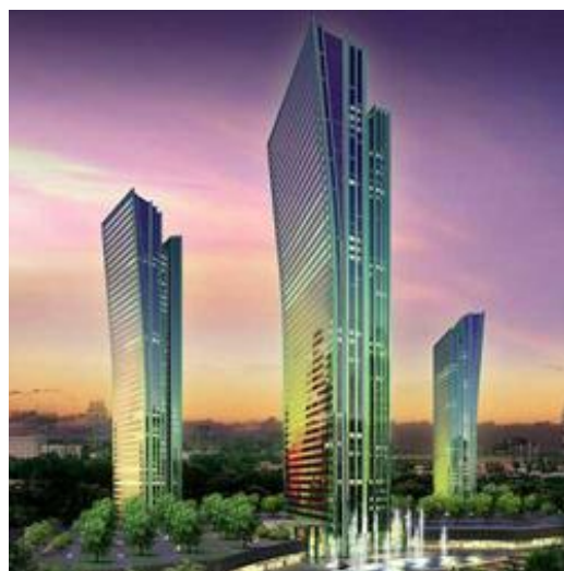
Сур.2. «На водно-зеленом бульваре» тұрғын үй кешені, «Изумрудный квартал» Астана, қ.