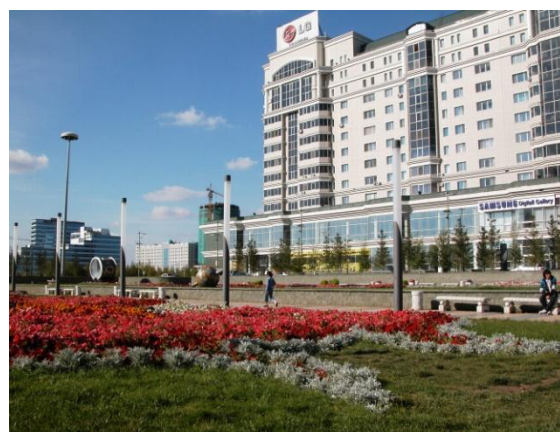
Сур.7 «Нурсая» тұрғын үй кешені

Сонымен, Астана сәулетінің жаңа тұрғын кешендерінің қарама қайшылық тенденцияларының арнасында құрылуы, солардың ішінде жаңашыл хай-тек, функционализм, неоклассицизм, әртүрлі тарихи стильдердің эклектикалы араласуы. Тағы ескерілетін бір жай, ұлттық стильдерінің азғана ізденіс мысалдары, тұрғын үй ғимараттарының сыртқы және ішкі келбет декорында дәстүрлі қазақ символ элементтерін айқындап қолдануы болып табылады. Қазақстан тұрғын үй кешендерінің жалпы сәулеті, қазіргі заман сұрағына жауап беруге ынталанып, көп стильді бейнесімен айқындала, көпжоспарлы дамуда.