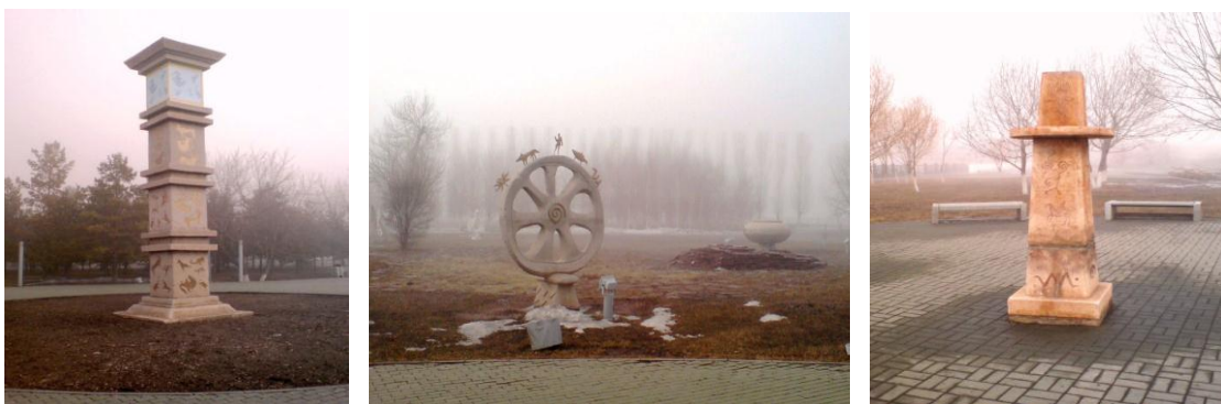
Рис. 7. Декоративная скульптура

Азиатская часть парка по композиционной задумке состоит из окружностей разной длины, в которых располагаются стела или целая группа скульптур по центру или разбросанном порядке. Вдоль главной дорожки располагаются декоративные скульптуры, с высеченными на них петроглифами. Эта дорожка примыкает к той части парка, где расположен памятник, возведенный в честь Мустафы Кемаля. Такие малые архитектурные формы как, утилитарного назначения (фонари, скамейки, подсвечники), декоративная скульптура, декоративные камни, монументальные скульптуры с азиатскими мотивами придают парку чувство полноты и своеобразия (рис.7).