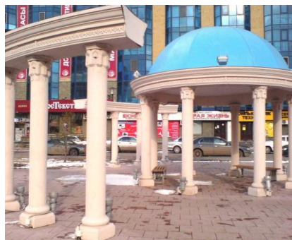
Рис.4. Малые архитектурные формы на ул. Уалиханова

Еще одним примером сочетания западного и восточного стиля является сквер расположенный на ул. Уалиханова. (рис. 4)