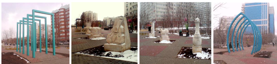
Рис.3. Арки-пропилеи и садово-парковые скульптуры

Малая архитектурная форма - скульптура «Ровесник Астаны», расположенная на стилобате, является дополнением к идейно-смысловому значению композиции. С детства в нашей памяти остаются неизгладимые и ни с чем не сравнимые впечатления раннего утра. Сидящий мальчик глядит на восход солнца, охваченный мечтой о будущем. Мальчику 10 лет, он ровесник родного и любимого города Астаны. В мечтах, обняв колени, он смотрит в небо через шанырак, символизирующий единство необъятных просторов нашей родины на пространстве Евразии, и размышляет о своем будущем, которое неразрывно связано с будущим Астаны. В это время над мальчиком, возле своего гнезда, кружат ласточки, символизирующие мир и тишину. Окно в совокупности с ласточками, над которым они свили гнездо, символизирует собой благополучие и покой дома, в котором растет и воспитывается малыш. Казахский народ издавна мечтал о своей независимости и свободе. Эта работа - посвящение сбывшейся мечте. Мальчик, ровесник Астаны - ее олицетворение [2].