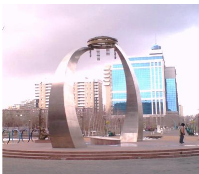
Рис.2. Объемно-пространственная композиция «Евразия»

Центральная архитектурная композиция размещена в центре сквера на границе европейской и азиатской зон и выполнена в виде двух дугообразных стел символизирующих движение двух континентов Европу и Азию навстречу друг другу, а также являющихся частями бесконечно развивающихся спиралей, стремящихся к единству (объединению), поэтому логично, что, завершающим элементом композиции в роли условного моста связывающий эти континенты выступает объединяющий элемент, символ единства - шанырак, в данном случае олицетворяющий добрососедство стран Азии и Европы. Четыре подвески на шаныраке обозначают объединение в единое целое четырех сторон света Севера, Юга, Востока и Запада. В самом центре основания на стилобате устанавливается круглый, рельефный диск на котором в виде логотипа изображены геометрические знаки - круг и квадрат, условные символы - Европы и Азии. Идеино-смысловое значение всей композиции выражается словами - «Евразия - наш общий дом» ( рис. 2).