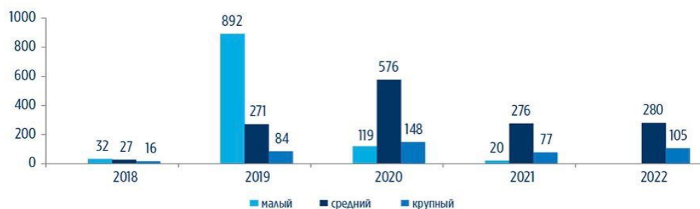
Диаграмма 2-Число налоговых проверок по особому порядку в разрезе субъектов предпринимательства за 2018-2022 годы

В связи, с печальными цифрами за последние годы был введен новый вид проверок-периодические налоговые проверки на основе оценки степени риска. Так, например, с 2020 по 2024 годы в соответствии с поручениями Главы государства в целях улучшения условий для развития микро и малого предпринимательства введен мораторий на налоговые проверки (кроме внеплановых проверок) .